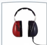
Casque CA DD65 v2