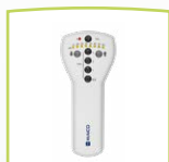
Appareil portable MA 1