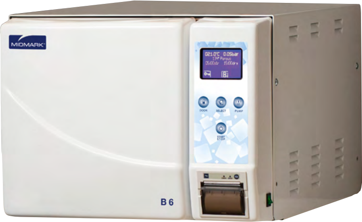
B6 Cuve 6 litres 6 litre chamber

Gamme complète de 6 à 23 litres Complete range 6 to 23 litres