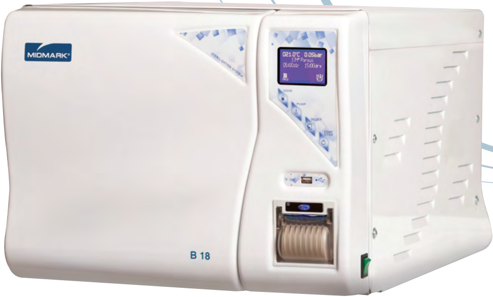
B18 Cuve 18 litres 18 litre chamber